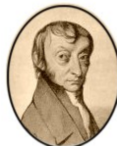
Amedeo Avogadro. Italia (1776-1785)

Masa de 6,02 \cdot 10^{23} átomos de C: 12,0 g