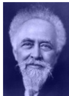
Jean Perrin Francia (1870 -1942)